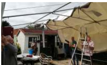
De tent achter Ons Huis wordt hersteld