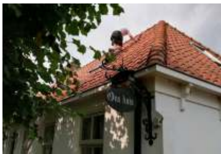
En het dak van Ons Huis wordt hersteld