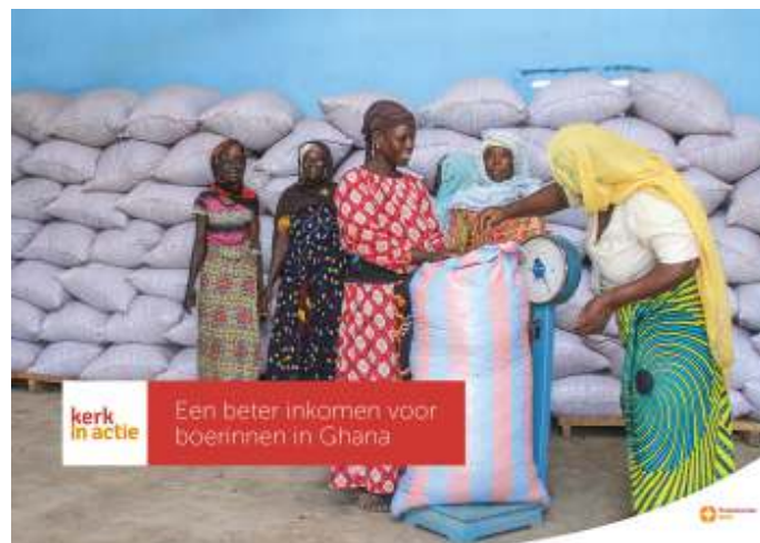
Woorden én daden: Projecten van Kerk-in-Actie