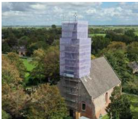
De toren van de kerk krijgt een opknappbeurt en waar is de haan gebleven?