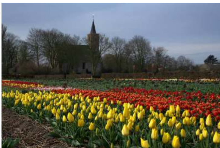
PKN Kerk Limmen met DucvanToltulpen

De redactie wenst u veel leesplezier toe.