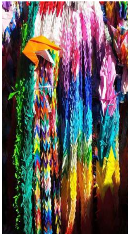
Papieren kraanvogels hangen buiten het Kindervredesmonument in Hiroshima.