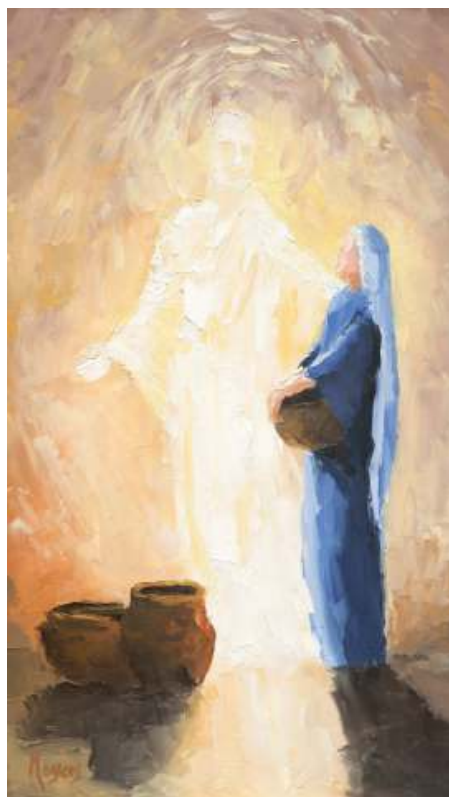
The Annunciation by Mike Meyers op https://globalworship.tumblr.com