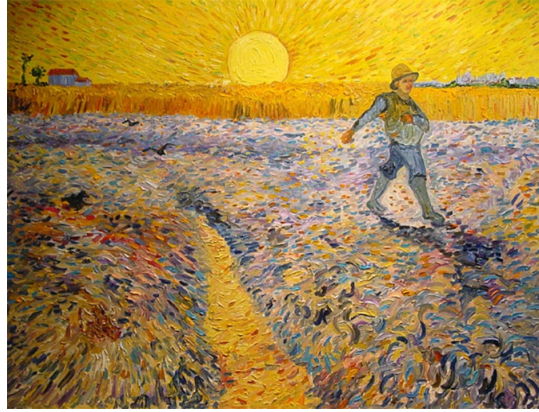
Vincent van Gogh: De Zaaier (1888)