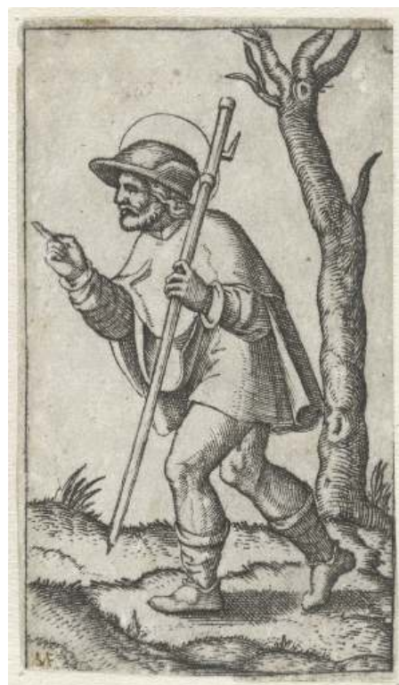
Heilige Rochus met staf, als pelgrim