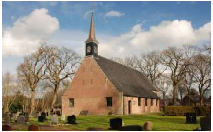
Boerenschuurkerk, Paasloo, Drente

Het eerste huis om God te kunnen aanbidden was de tabernakel, de tent die de Israëlieten bouwden in hun reis door de woestijn. De essentie van de tent is dat hij draagbaar is. God geeft de opdracht voor de bouw van dit heiligdom 'zodat ik temidden van hen (de Israëlieten) kan wonen' (Exodus 25: 8). Het heiligdom was niet gemaakt als plek waar God méér aanwezig was dan elders maar als plek, als speciale ruimte die uitnodigde om het hart voor Gods aanwezigheid te openen. God is overal, maar niet overal voelen we die aanwezigheid op dezelfde manier.