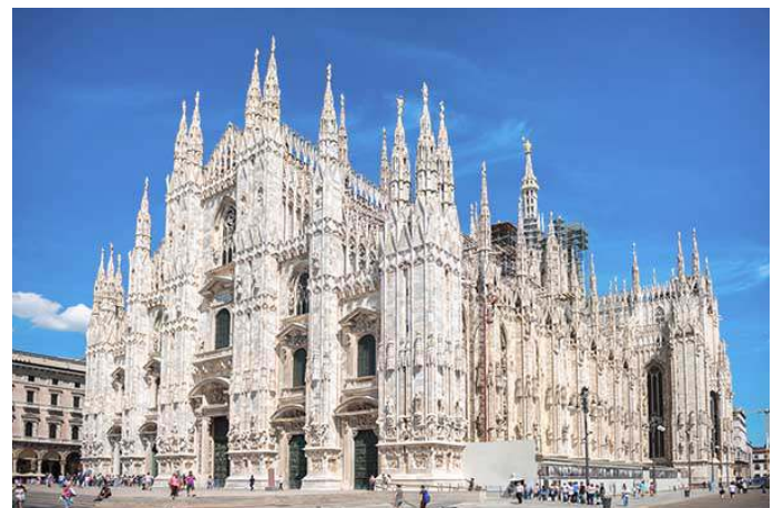
Voorgevel van de Dom van Milaan