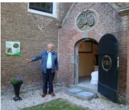
Grafhuisje met alliantiewapen van Dupeyrou

GGZ-vieringen zijn voorlopig te volgen via YouTube-livesize-