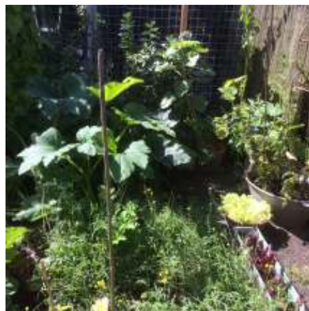
De groentetuin van ....?