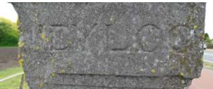
De drie afbeeldingen zijn van de oude grenspaal tussen Heiloo en Limmen aan de 'Rijksweg'.