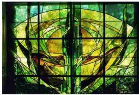
Glas in lood: Oase (Ter Coulsterkerk)

Tot ziens op vrijdagavond 8 maart om 18.00 uur in 'Ons Huis' in Limmen. Oecumenisch platform Limmen