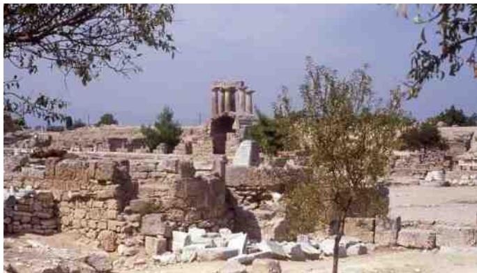
Bijbels ABC over Korinthe

3 oktober: 'Franciscus van Assisi'; Willibrordushuis 7 okt.: Wat vieren we zondag; 13.30 Ter Coulsterkerk 9 en 23 oktober: Bijbels ABC; 14.30 Prot. Kerk Limmen 10 en 31 okt.: Ontmoetingsmiddag; 14.15 Ter Coulsterkerk 10 en 31 okt.: Zin in poëzie en schilderkunst; Ter Coulster 13 oktober: Bachcantate; 16 uur Witte Kerk 22 oktober: Bijbelgroep Richteren; 20 u. Willibrordushuis 4 en 11 nov.: 'Het spirituele leven'; 20 u. Willibrordushuis 7 nov.: Stilte en meditatie: 20 u (19.45) Ter Coulsterkerk Voor meer informatie: zie het informatieboekje van Rond de Waterput of www.ronddewaterput.nl